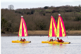
Planche à voile

Premiers bords, à trois, à deux ou en solitaire, et de manière ludique !